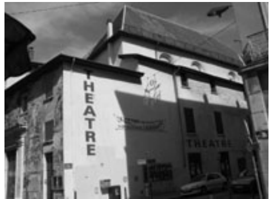
Théâtre du Rio, rue D. Villard

Le site du Théâtre le Rio et ancien couvent Sainte Cécile pourrait être vendus par la Ville à l'éditeur GLENAT qui y installerait son siège social, ses dessinateurs et concepteurs (une centaine de salariés). L'ancienne chapelle pourrait devenir un lieu d'exposition de son savoir faire d'éditeur. Le petit jardin serait accessible aux heures d'ouverture.