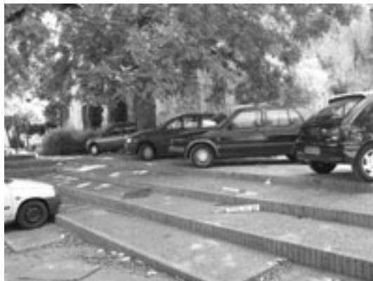
Parking sauvage, Cour de l'Alma

Rue Lafayette : sol affaissé en maints endroits : aucun changement depuis l'an dernier : aucune intervention prévue.