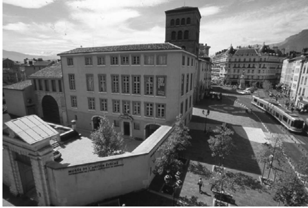
(Musée de l'ancien évêché, cliché : D. Vinçon)

Si l'on prête attention, en traversant la place Notre-Dame depuis la rue Frédéric Taulier, du côté de la voie qui borde le groupe cathédrale (l'ancien Evêché, l'église Saint-Hugues et la cathédrale Notre-Dame), on peut voir, sur le sol en légère déclivité, un marquage figuré par des dalles de couleur claire. Un linéaire blanc interrompu puis se poursuivant vers la voie du tram, un trèfle à quatre feuilles aux abords de la cathédrale désignent aux passants l'emplacement des vestiges antiques de la ville : l'enceinte gallo-romaine et le baptistère des premiers temps chrétiens, que l'on peut visiter