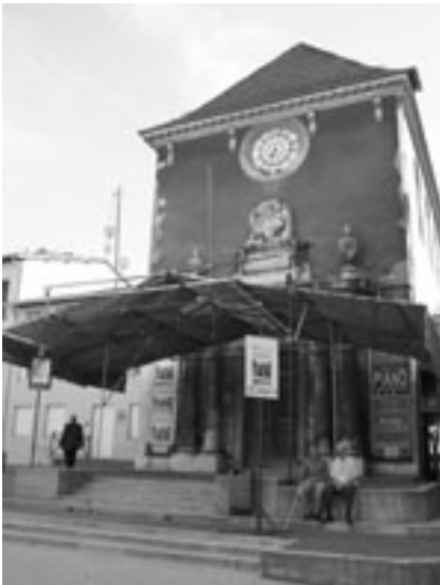
Ste-Marie-d'en-bas, rue Très Cloître

Le 18 septembre prochain, fête d'inauguration du Foyer ODTI. Mais quel financement pour le projet de Cité sans Frontières ?