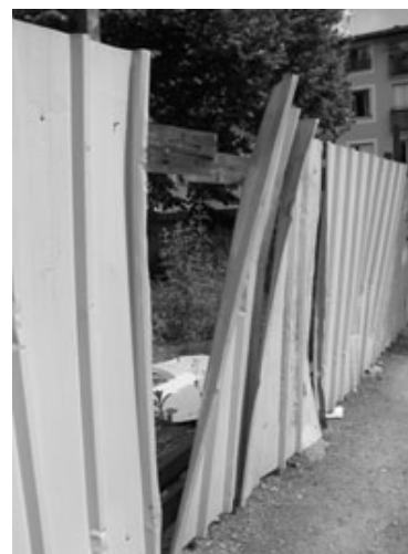
Palissade dangereuse, Cour de l'Alma

Cour de l'Alma : elle a été très belle il y a quelques années avec un terrain de jeu (volley, ping-pong) pour les ados, un espace pour les petits, un lieu de rencontre et de papotage sous un arbre magnifique.