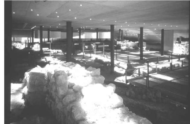
(Baptistère de Grenoble)

Pénétrant dans le site archéologique, en sous-sol du musée, le visiteur