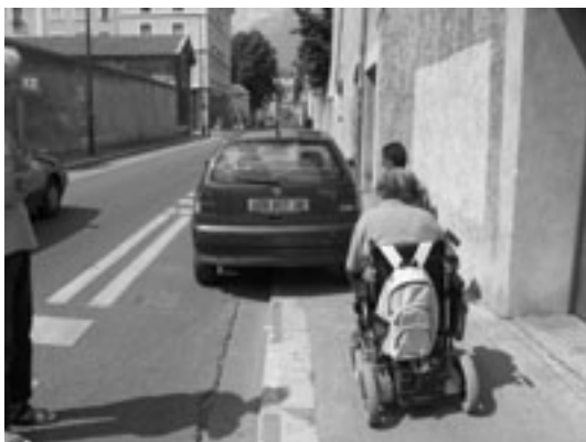
Rue de l'Alma

Le trottoir de la rue Bayard qui a été laissé entièrement libre pour les piétons (côté pair) est souvent encombré par des motos. Rue de l'Alma : une seule voiture stationnée sur le trottoir et les personnes en fauteuil doivent faire