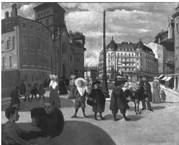
Place Notre Dame de Grenoble 1900 François-Joseph Girot

Nous vous recommandons vivement d'aller voir la magnifique exposition de peintures, dessins et estampes offrant un panorama unique sur différents visages de la ville entre le XVI e siècle au début du XX e siècle. Ouverture jusqu'au 14 avril. Accès gratuit. Visites guidées possibles.