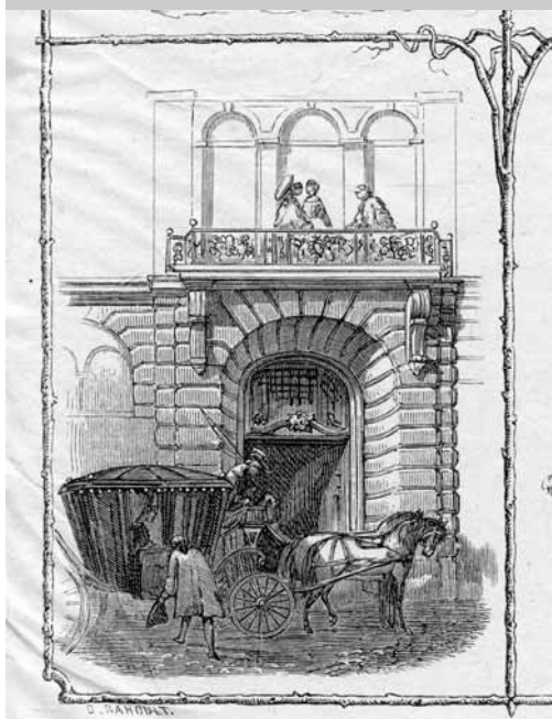
Porte d'entrée de l'immeuble rue Brocherie - Dessin provenant de l'ouvrage « Grenoble Malhérou »

(Hôtels Pierre Bücher et Croy Chasnel, 6 rue Brocherie à Grenoble)